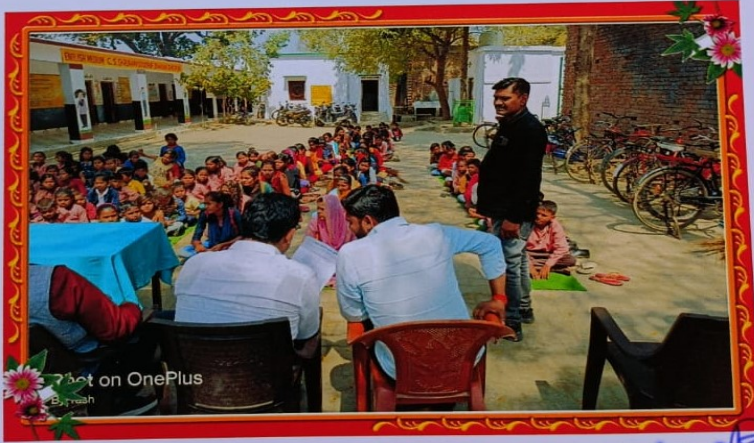
मध्याह्न संगोष्ठी में स्वयंसेविकाएं एवं विद्यालय के बच्चों द्वारा शिक्षारी सहित 100 से 0 यों महात्मा गांधी शती स्मारक महाविद्यालय, गरुआ, मकसूदपुर-गाजीपुर