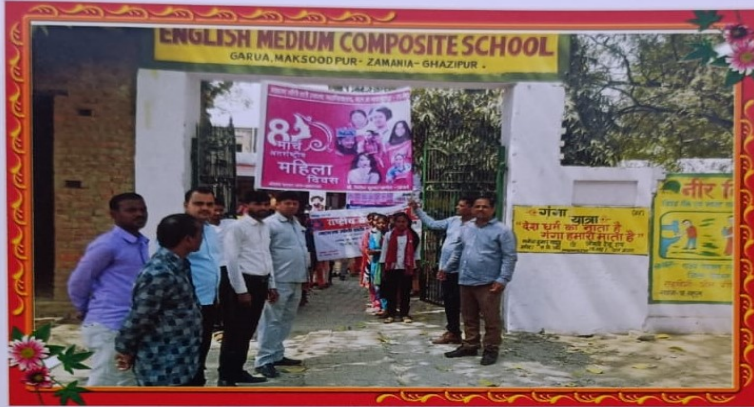
08 मार्च, महिला दिवस कार्यक्रम।